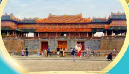
พระราชวังโบราณไคโนย

เมนูพิเศษ 1 กุ้งมังกรซอสเนย + หม้อไฟทะเล SEAFOOD 1 มื้อ, ปิ้งย่าง ซาซุ 1 มื้อ