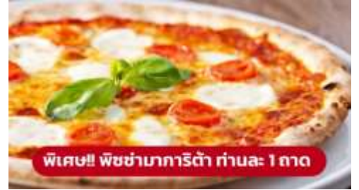
พิเศษ!! พิซซ่ามาการิตต้า ท่านละ 1 ถาด

🍕 รับประทานอาหารเที่ยง (มื้อที่1) เมนูพิเศษ!! พิซซ่ามาการิตต้า นำท่านเดินทางสู่ เมืองเวนิสเมสเตร (Venice Mestre) (ระยะทาง 264 ก.ม. / 4 ชม.) เป็นย่านเมืองเก่าแก่ที่มีความสวยงามและแสดงให้เห็นถึงความ เป็นอิตาเลียนขนานแท้