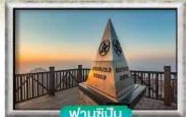
ฟานซีปัน