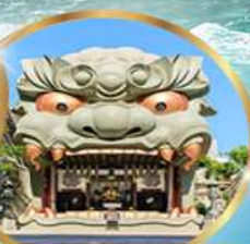
ศาลเจ้าอิมบะ ยาชากะ