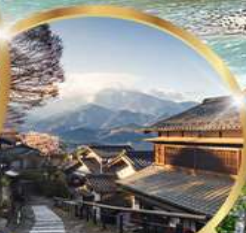
มาโกเมะจุกุ