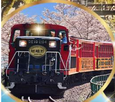
รถไฟสายโรแมนติก