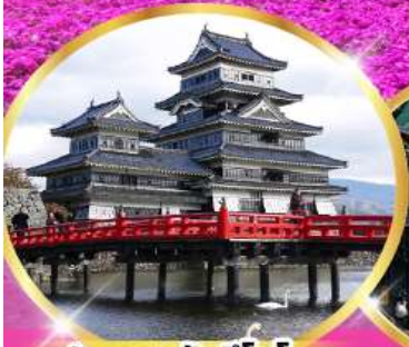
ปราสาทมัตสึโมโตะ