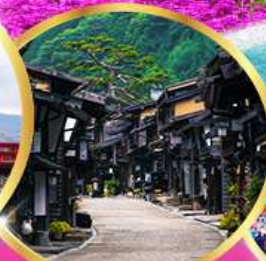
นาราอิซูกุ