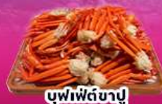
บุฟเฟ่ต์ซาปู