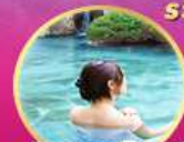
พักผ่อนเซ็น 1 คืน