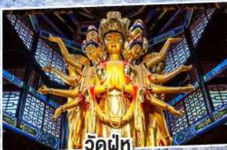
วัดฟูทู่