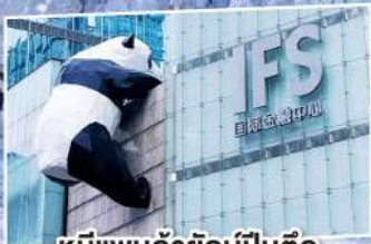
หมีแพนด้ายักษ์ป็นตึก