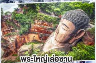
พระใหญ่เล่อซาน