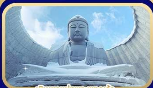
เป็นเขาแห่งพระพุทธรเจ้า