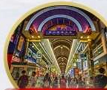
ช้อปปิ้งทานุกิโตรี