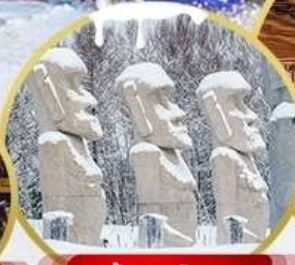
รูปปั้นหินโมอาย