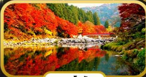
หุบเขาโครังเค