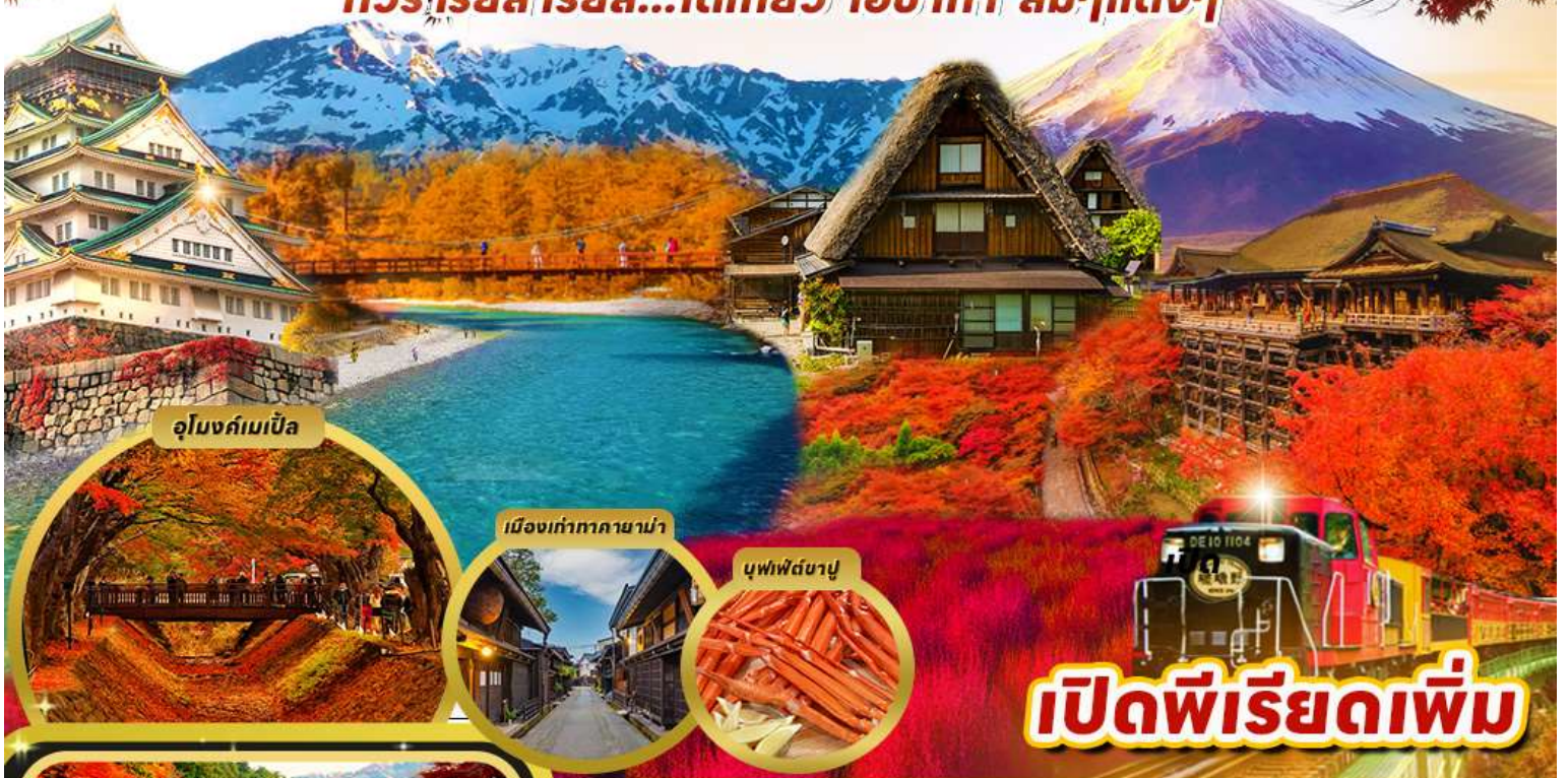
อุโมงค์เมบิล

ทัวร์เรือล เรือล...โตเกียว โอซาก้า สัม๗แดง๗